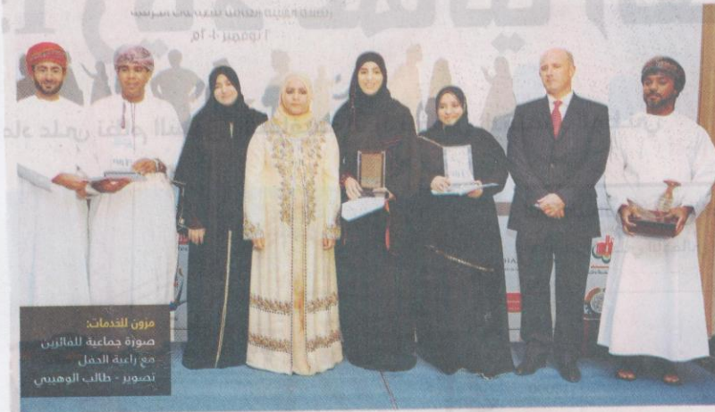
مزون للخدمات صورة جماعية للمنتخبين مع رابعة العمل

تنافس عليها 39 مشروعاً وصل منها خمسة إلى المرحلة النهائية