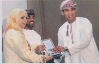
Intilaqah Awards Gala Dinner at Crowne Plaza