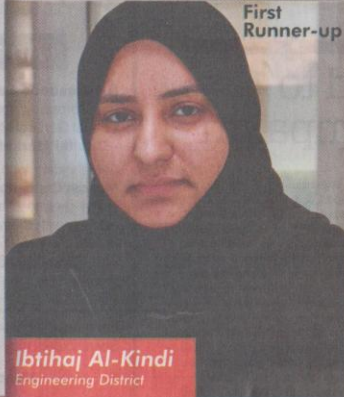
Ibtihaj Al-Kindi Engineering District